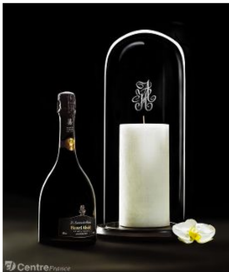
Le coffret Henri Abelé Sourire de Reims Brut 2007 - all rights reserved